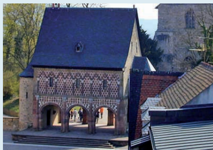
Karolingische Königshalle in Lorsch UNESCO-Weltkulturerbe

Für Neugierige: Donnerstag, 13.6., 19 Uhr: Eröffnungsabend StadtLeseStadt Lorsch 2013 mit dem „ Bibliophilen Highlight “; www.stadtlesen.com/lesestaedte/lesestaedte-deutschland/lorsch