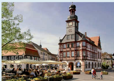
Altes Rathaus in Lorsch